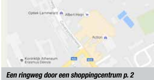
Een ringweg door een shoppingcentrum p. 2