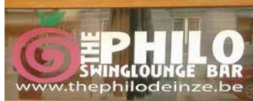
The Philo moet wijken voor appartementsblok p. 3