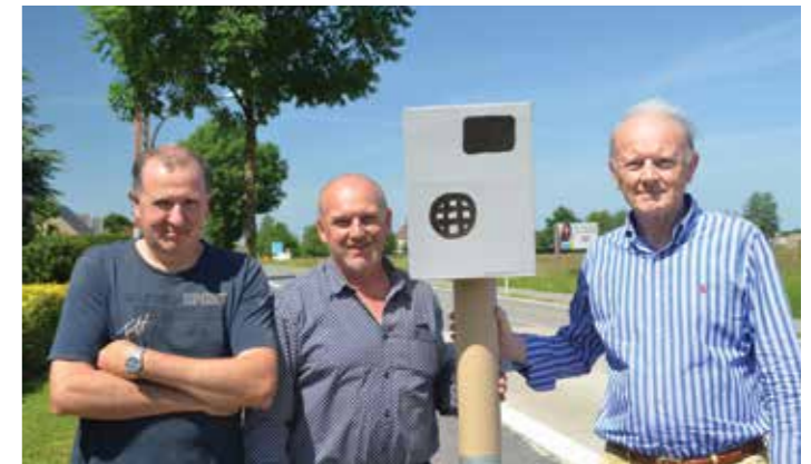
▲ De N-VA hield een flicspaalactie om snelheidsduivels op de Oudenaardsesteenweg tot vertragen aan te manen.

De bewoners wensen een degelijk voet- en fietspad langs beide zijden van de weg; één richting Kruishoutem en één richting Deinze. De meeste bewoners zijn ook te vinden voor