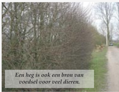
Een heg is ook een bron van voedsel voor veel dieren.

Wist je dat N-VA-minister Geert Bourgeois in Bachte-Maria-Lerne rond Vosselare-put ons "houten geheugen" beschermd heeft? Het betreft houtkanten van wegedoorn die een grote waardevolle cultuurhistorische en ecologische waarde hebben.