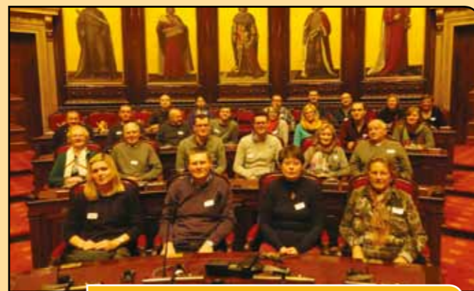
N-VA Deinze in de senaatszetels